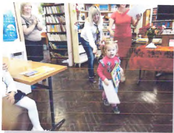
В конкурсе «Кореновская жемчужина»